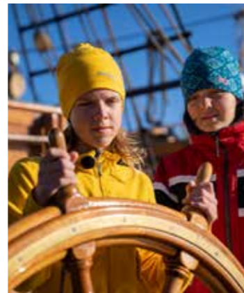
Syver styrer skuta