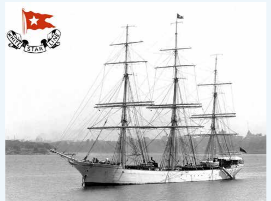
The White Star Line Training Ship "MERSEY" 1908 - 1914 Christiania Skoleskip "Transatlantic" 1916 - 1917

Kan det bli mer romantisk? En av Sea Norway turene fra Bodø i fjor sommer ble charret til bryllupstur- tre hele dager til ende! Arrangement, seilingsrute og meny ble nøye planlagt i god tid med kontoret, kaptein og stuert og det ble noen eventyrlige dager for brudepar og følge! For mannskapet er ingen utfordring for stor og dette gjør vi gjerne igjen!